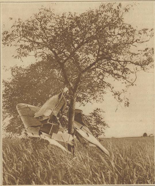
Ein Motorsdefekt zwang letzte Woche ein Flugzeug der Linie Basel-Genf zu einer Notlandung in der Nähe von Cossonay, wobei der Apparat gegen einen Baum geschleudert wurde und vollständig in Trümmer ging. Personen wurden keine verletzt. Ein aus Basel zu Hilfe gerufener zweiter Apparat wurde bei der Landung ebenfalls beschädigt. Unser Bild zeigt die am Baum hängenden Trümmer des Kursflugzeuges.