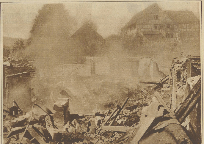
Die rauchende Brandstätte des großen Mühlenbrandes in Sitterdorf (Thurgau)