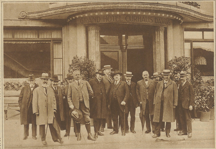
Die nationalrätliche Kommission für das zu schaffende neue Tuberkulosegesetz tagte letzte Woche im Grand Hotel Curhaus in Davos und besuchte bei diesem Anlasse auch verschiedene, dem Kampfe gegen die Tuberkulose gewidmete Institute.