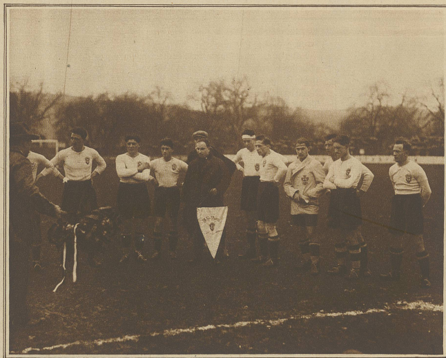
Fußball vom Sonntag