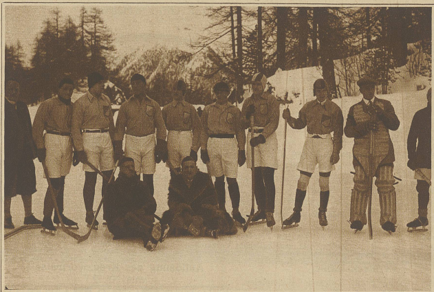
Die Eishockey-Mannschaft von St. Moritz, die am

Weihnachtstage gegen die London-Lions spielte