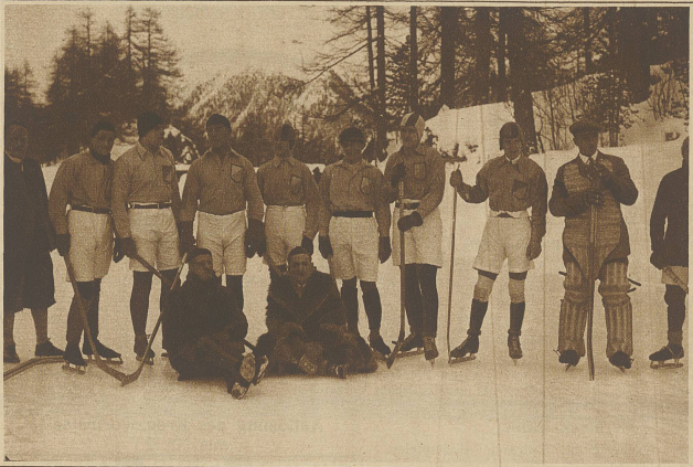
Die Eishockey-Mannschaft von St. Moritz, die am