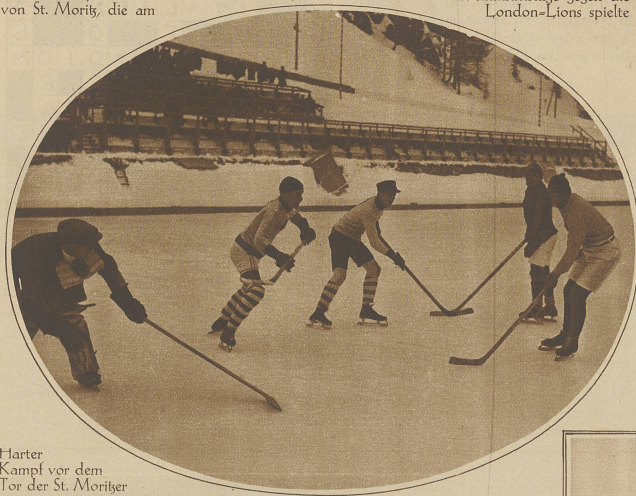
Harter Kampf vor dem Tor der St. Moritzer

Weihnachtstage gegen die London-Lions spielte