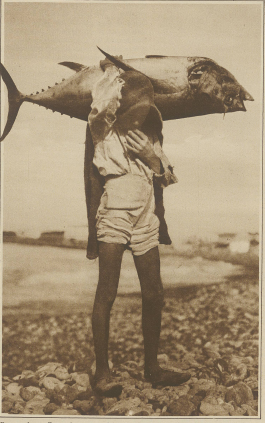
Ein produktives Exemplar eines auf den karolinischen Inseln gefangenen Theobalds