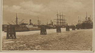
Blick auf den verkehrsreichsten Segelschiffhafen von Hamburg, dessen Verkehr durch das viele Treiben betrüblich vollständig behindert wurde