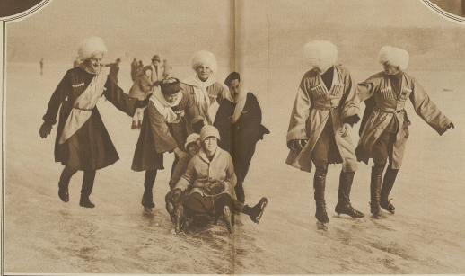
Russische Emigranten in typischer Kasackuniform versorgen sich von Lebensmitteln