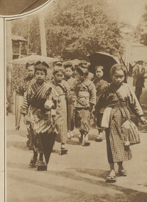
Japan. Japanische A. B. C. -Schüler auf dem Weg zur Schule. Man beachte die eigenartige Fußbekleidung