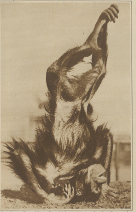
Dem Rassen «Crang-Li» «Kong», die Leuchtener tragendsten Urtiere geht es so gut, daß er von Vespertigen auf dem Berge steht