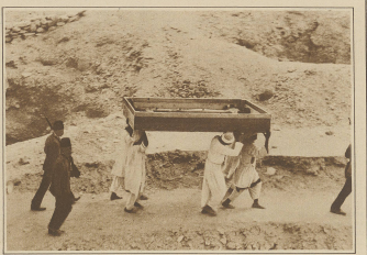
Die Mysterien des Pharaonenbegräbnisses. Transport eines Leichnams aus dem Grab des Tutankhamun unter ständiger Begleitung