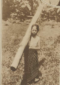
Ein Wasserträger auf den Philippinen. Das Wasser wird in einem großen Bambusrohr von Brunnen geholt