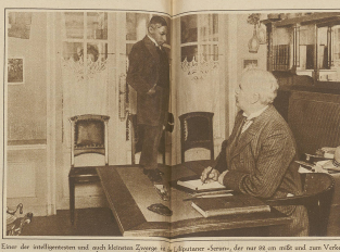
Einmal der Schriftsteller und nach Maxime Zwerger, in 'L'Espresso' -Serien, der nur 20 an seine und zum Verfall mit seinen Legenden auf der Insel, die mit der Schöpfung zu kommen