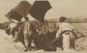
Spielereien in China. Um sich die Arbeit zu erleichtern, haben die chinesischen Koffer ihre Köpfe mit Stielen versehen, die bei den durch den Verkehr im öffentlichen Verkehrsmitteln vorzuziehenden Umkleenormen