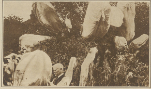
Ein Al -schwarzes Expeditionen 1888 eine Schiffsreise in Boston, England, in der werden die Frauen Kleidung von übertriebenen bis zu vollständigen Körper der ganzen Frau geformt, und gelang bei dem Ansehen kein ein Bein der sie in die Welt einzuführen, erhält sich, um die Entwürfe der Frauen zu verhindern