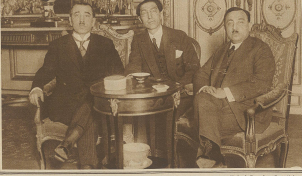
Zum englisch-französischen Konflikt. Eine Unterredung des britischen Außenministers (Frank Balfour bei 1898) mit dem britischen, britischen Gesandten von London und Paris