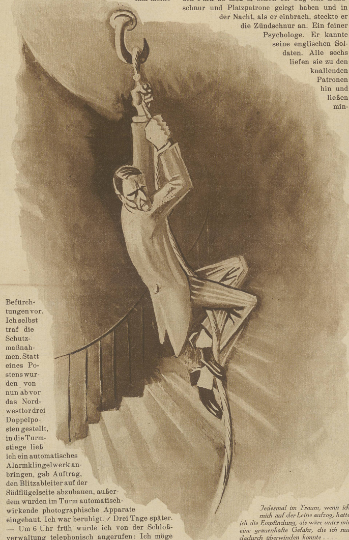
Jedesmal im Traum, wenn ich mich auf der Leine aufzog, hatte ich die Empfindung, als wäre unter mir eine grauenhafte Gefahr, die ich nur dadurch überwinden konnte ...

Am nächsten Tage bat ich beim Minister des königlichen Hauses um Audienz und trug ihm meine