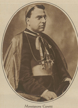
Monsignore Ceretti Erzbischof von Korinth und päpstlicher Nuntius in Paris, wird zum Kardinal ernannt