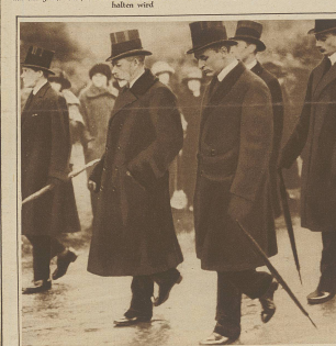
Reisegelegenheiten für die Königin-Mutter Alexandra von England Der Prinz von Wales, König Georg von England und Kronprinz Olaf von Norwegen im Trauerzuge