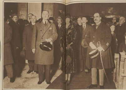
Empfang der Königin von Spanien