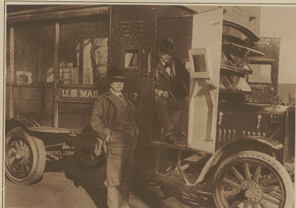
Ein überfälliger amerikanischer Postautomobil. Die vielen Unfälle auf die Postautos haben die amerikanische Post-Departement zur Anschaffung einer Anzahl besonders konstruierter Automobile veranlaßt, deren Verordnungen mit schützenden, durchsichtigen Schildern versehen und deren Seitenwände mit Stahl gepanzert sind