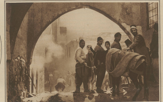
Eine seltene Aufnahme aus Damaskus während der Beschießung durch die Franzosen. Eingeborene bringen ihre Habe in Sicherheit