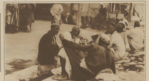
Straßenbild aus Samarkand. Eine Gruppe Turkestaner lauscht einem Märchenerzähler