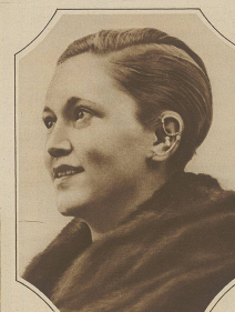
Die neueste Frauensmode. Die in der Bilden stehende Chinesin wird 1911 in Amerika getragen. Wie man sieht, entbehrt sie nicht auf die ganze Che, an dem er durch ledere Klammern festge- halten wird