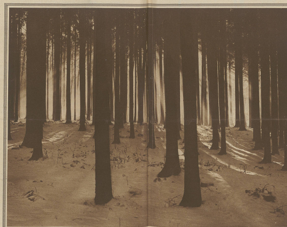
Winterstimmung im Hochwald