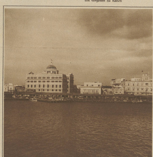
Bilder aus Havanna