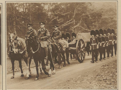
Der Trauerzug unterwegs zur Abdankung