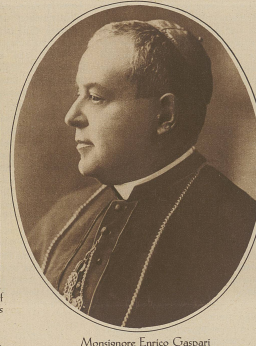
Monsignore Enrico Caspari Erzbischof von Sebastopol und päpstlicher Nuntius in Rio de Janeiro, wird zum Kardinal ernannt