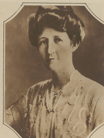
Mrs. Miriam Ferguson, der weltliche Gouverneur des Staates Texas, ist in eine große Beetholungsaffäre verwickelt. Man weiß die vor- staatsrechtliche gegenwärtige Tätigkeit des bekannten Gouverneurs vergeben zu haben