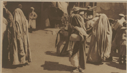
Straßenbild aus Samarkand. Die Frauen gehen nach alter Sitte völlig verhüllt auf den Markt