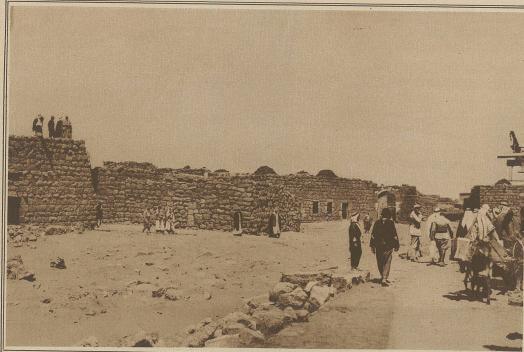
Zu den letzten Ereignissen in Syrien. Araber und Franzosen auf einem französischen Vorposten in Bors-el-Farrir während der Beschießung des Hauptquartiers der Drusen in Seveida