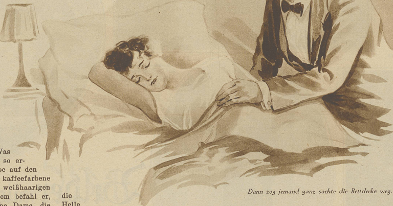
Dann zog jemand ganz sachte die Bettedecke weg.

Es bekam Gänsehaut, denn es glaubte in einem Mörderhaus zu sein. Dann drückte es die Augen zu, fest, fest, als schliefe es tief. Es war jetzt zum Ende ganz, aber auch ganz gleichgültig, was mit ihm geschah. Morgen ging es ja doch ins Wasser. Wenn es jetzt gemordet wurde, um so besser, dann hätte es keine Todsünde verbrochen und käme sicherlich in den Himmel. Und dann — geschah ihm ja mit allem nur ein allerdings hartes und blutiges Recht. Hatte nicht die Mutter zu Hause in Nieburg gesagt, daß alles so kommen müsse! Hatte sie nicht weinend prophezeit, was für Elend der schlechte Schorschli über sein Haupt bringe. Hatte dies nicht alles sein gutes, liebes, armes Mütterlein vorausgesagt, das Mütterlein zu Hause, ach zu Hause — Doch, wie auch das Grütli wartete, bis der Tod kam, es spürte vorerst nichts, außer durch die geschlossenen Lieder