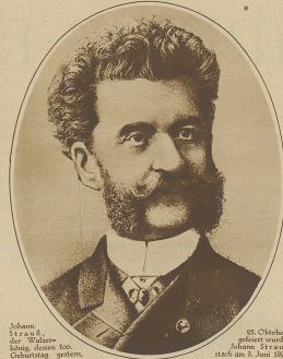
Schuber, Präsident wurde, Johann Strauß stand am 2. Juni 1897