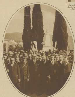
Ministerpräsident Poincaré und Kammerpräsident Herriot vor dem Denkmal Gambettas in Nizza.