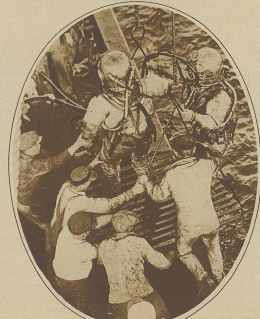
Ein schwerer Brand. Amerikanische Taucher, mit der Bergung der Leichen der Untergangenen 5 81 beschäftigt, werden an Bord geholt.