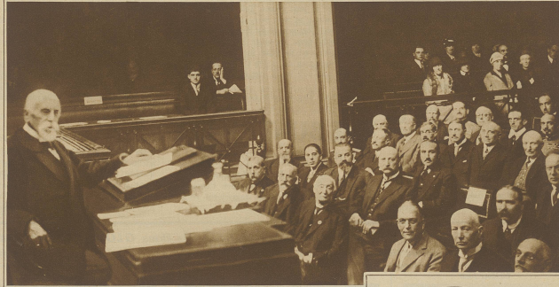
Kongress des internationalen Roten Kreuzes in Genf. Links im Bilde der Präsident, alt Bundesrat Adler