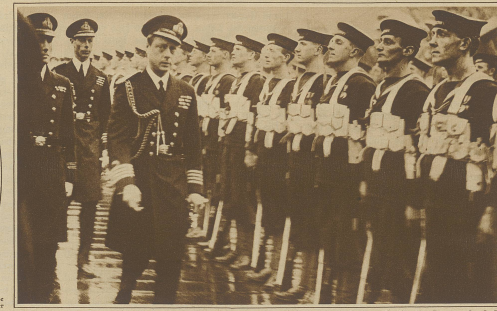
Der Prinz von Wales ist nach einer Weltreise von 6 Monaten wieder nach England zurückgekehrt. Unser Bild zeigt ihn beim Abschieden der Ehrenkompanie in Portsmouth.