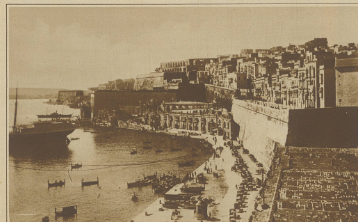
Eine Spielhölle auf Malta. Die autonome Regierung von Malta beabsichtigt die Einrichtung einer großen Spielhölle nach dem Vorbilde Monte Carlos. Unser Bild zeigt einen Blick auf Hafen und Stadt.