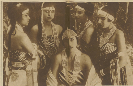
Junge ind. Filmschauspielerinnen, reich mit Perlenschnitzwerk.