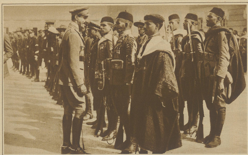
Empfang aus Marokko zurückgekehrter Truppen in Madrid. König Alfons im Gespräch mit maurischen Soldaten des Bataillons des Infanterie.