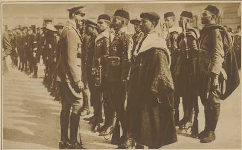
Empfang aus Marokko zurückgekehrter Truppen in Madrid. König Alons in Gespräch mit maurischen Soldaten des Bataillons des Infanterien