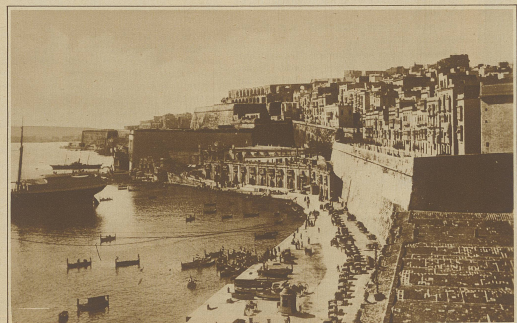
Eine Spielfelle auf Malta. Die autonome Regierung von Malta beabsichtigt die Einrichtung einer großen Spielfelle nach dem Vorbilde Monte Carlo. Unser Bild zeigt einen Blick auf Hafen und Stadt