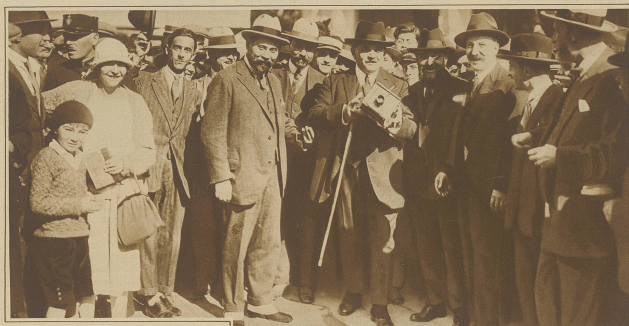
Ein wichtiger Interviewer erwartet sich anlässlich des Pariserkongresses der Katholiken in Neuchâtel. Der französische Kameramann Herr Herriot, der beim Verlassen des Stempels wieder einmal im Kreis der Photographen stand, erhielt plötzlich einen Photographenposten mit den Worten: „So, meine Herren Photographen, jetzt macht es die einmal im Bild fassen.“