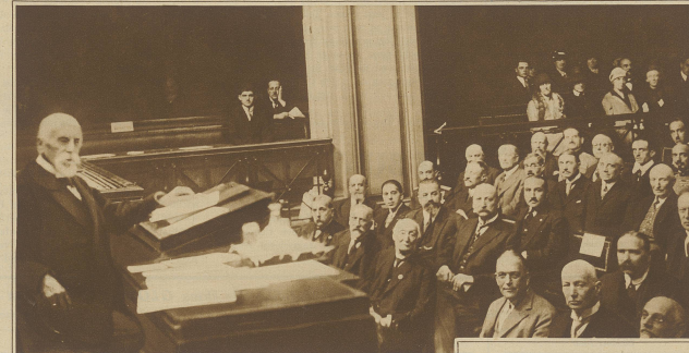
Kongress des internationalen Roten Kreuzes in Genf. Links im Bild der Präsident, alt Bundesrat Ador.