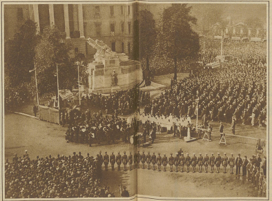
Die Enthüllungsfestlichkeiten des Denkmal für die Gefallenen des königlichen Artillerieregiments in Hyark Corner in London