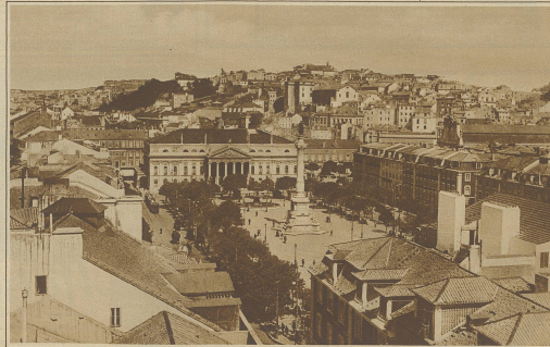
Aus der Hauptstadt Portugals. Blick auf einen Zierplatz Lissabons mit dem Standbild Don Pedros IV.