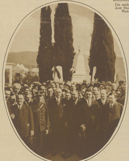
Ministerpräsident Painlevé und Kammerpräsident Herriot vor dem Denkmal Gambettas in Nizza