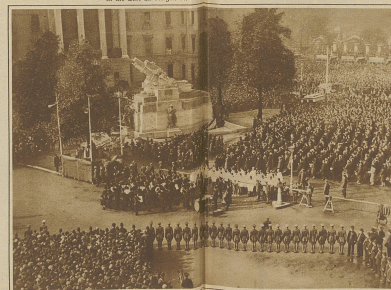
Die Enthüllungsfestlichkeiten des Denkmals für die Gefallenen des königlichen Artillerieregimentes in Hyde Park Corner in London.