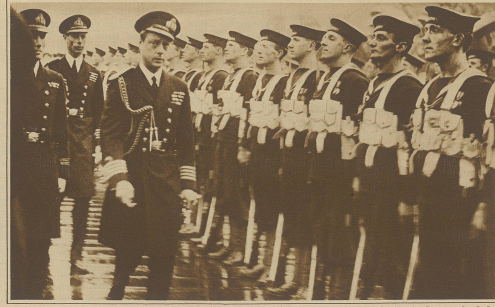
Der Prinz von Wales ist nach einer Weltreise von 6 Monaten wieder nach England zurückgekehrt. Unser Bild zeigt ihn beim Abschieden der Ehrenkompanie in Portsmouth