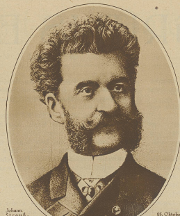
Johann Strauß, der Wiener König, dessen 100. Geburtstag gefeiert wird.