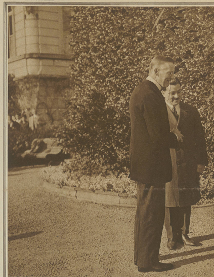
Eine stimmungsvolle Geburtstagsfeier war am Freitag dem englischen Außenminister Chamberlain, dem seinem größten Werk, dem erfolgreichen Abschluß des »Friedens von Locarno«, seinen 60. Geburtstag zu feiern. Ein Festessen