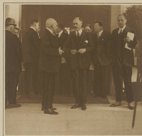
Reichskanzler Dr. Luther im Gespräch mit Journalisten nach dem Presse-Bankett