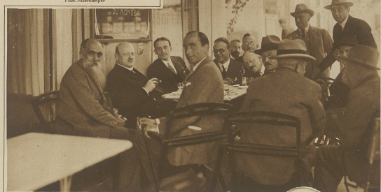
Stresemann orientiert die Presse beim Abendessen