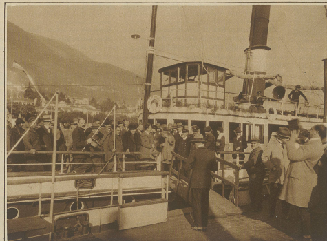
Briand inmitten deutscher Journalisten auf einer Vergnügungsfahrt nach dem glücklichen Abschluß der Konferenz