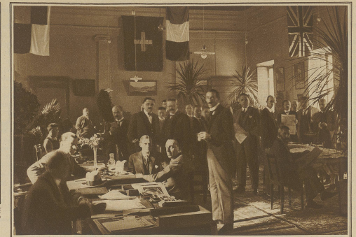
Blick in den Pressesaal