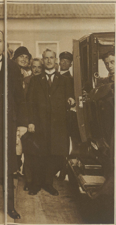
an der Schluß-Sitzung