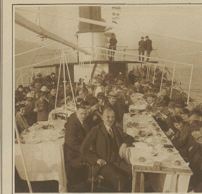
Das Presse-Bankett auf dem Schiff