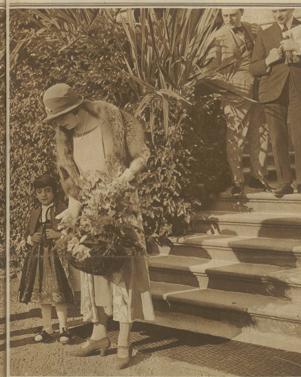
Der englische Außenminister Chamberlain, der seinen Geburtstag am Freitag feierte, konnte er doch diese Feier mit Mädchen bringt den geleiteten Paar seine Glückwünsche dar