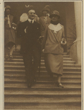
Chamberlain und seine Gemahlin verlassen die glücklich beendete Schlußsitzung unter ansehnlichem Beifall der begeisterten Menge