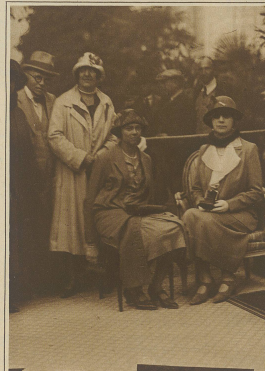
Mrs. Chamberlain wartet auf ihren Gemahl während der Schlußkonferenz