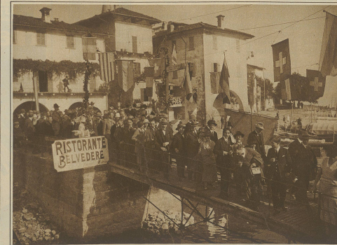
Die Pressevertreter auf dem Landungssteg