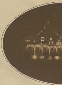
Das weit in die Lande leuchtende Friedenszeichen »PAX« auf der Madonna del Sasso