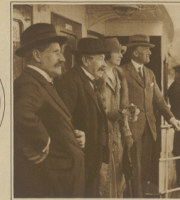
Chamberlain, seine Gemahlin, Briand und Bebel erwarten auf dem Schiff die deutsche Delegation