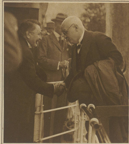
Herzliche Begrüßung zwischen dem deutschen Reichskanzler, Dr. Luther, und dem französischen Außenminister Briand