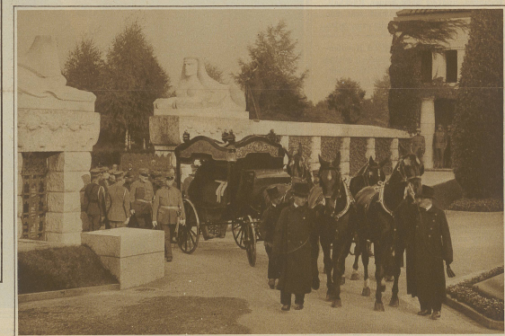
Am Eingang ins Krematorium