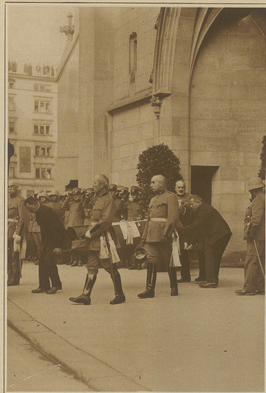
Nach der Abdankung in der Fraumünsterkirche