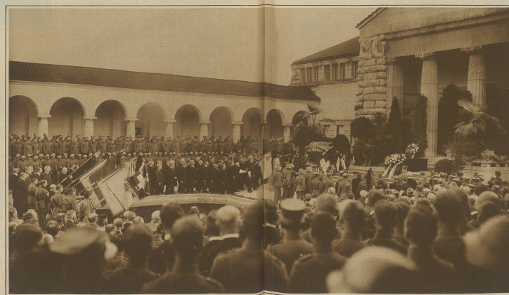
Der Sarg entschwindet, die Fahnen senken sich. Drei Schüsse ins kühle Grab...