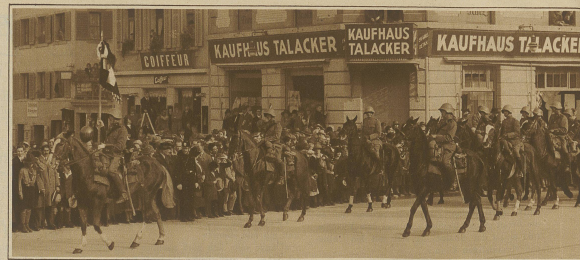
Die Kavallerieschwadron im Trauerzuge