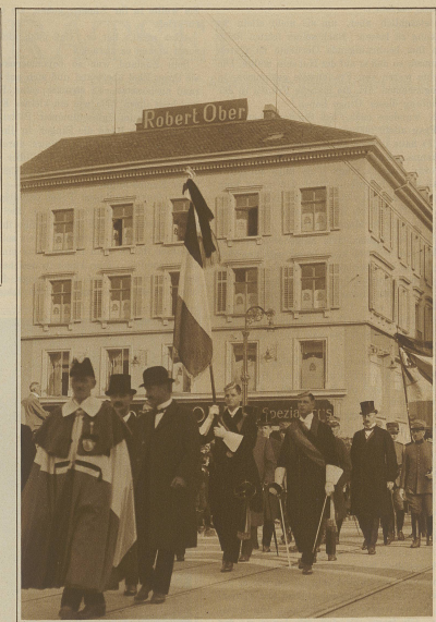
Abordnungen der Behörden und des Corps Tigurina