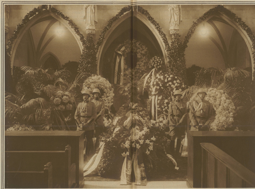
Die Ehrenwache am aufgebahrten Sarge in der Fraumünsterkirche