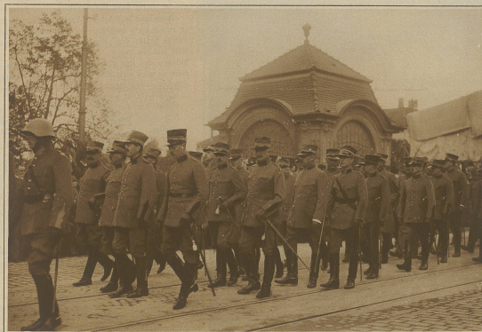
Offiziere in Trauerzuge