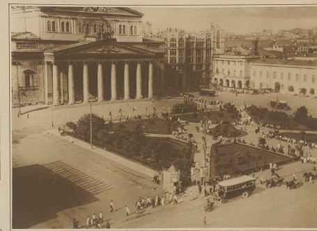
Das neue Moskau. Unsere Aufnahme zeigt den Theaterplatz mit einigen modernen Autobussen, die dieser Tage dem Verkehr übergeben wurden