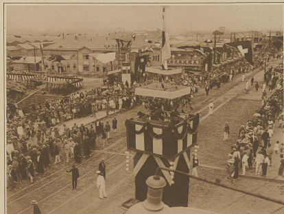
Ansicht eines seit dem letzten großen Erdbeben wieder aufgebauten Viertels von Tokio anlässlich eines festlichen Umzuges