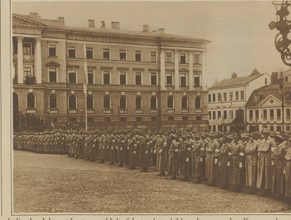
In Finnland hat sich eine weibliche Schutzwehr gebildet, die unter dem Kommando von Offizieren steht und sich als Teil der finnischen Heeresmacht betrachtet