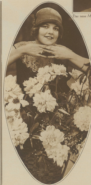
Ein reisender Strauß