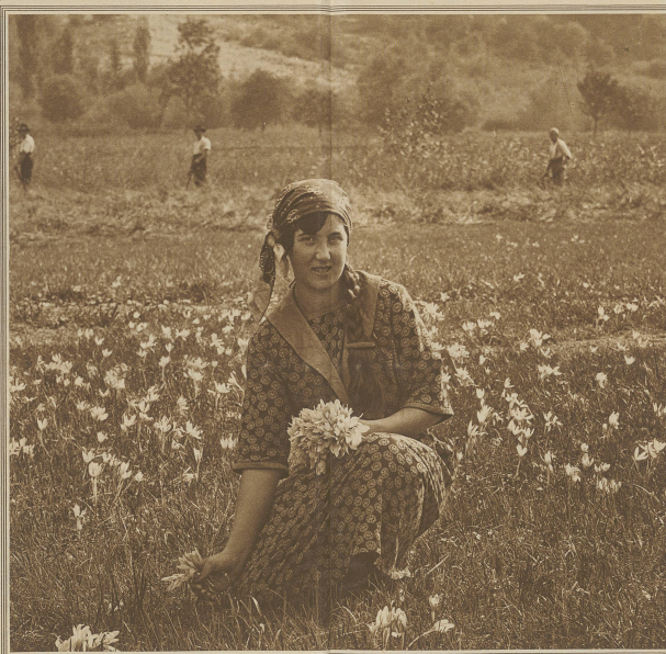
In den Herbstzeitlosen