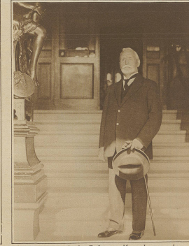
Raoul Dandurand, der Delegierte Kanadas, wurde zum Präsidenten der Völkerbundsversammlung gewählt