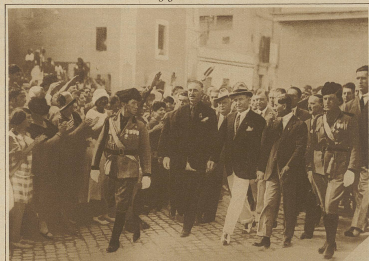
Die neueste Aufnahme des italienischen Ministerpräsidenten Mussolini an der Spitze eines Straßenzuges seiner Parteigänger in Anzio