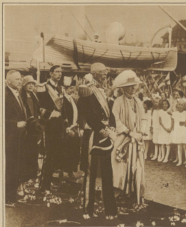
Schwedischer Königsbesuch in Finnland. Die königlichen Gäste bei ihrer Landung in Helsinki