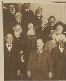
Einige Teilnehmer am internationalen Spiritistenkongress in Paris