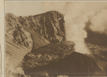
Der Vesuv in Tätigkeit. In diesen Tagen hat sich die Tätigkeit des Vesuv bedenklich verstärkt, eine mächtige Rauchsaule überragt den Krater u. versetzt die Bevölkerung in panischen Schrecken