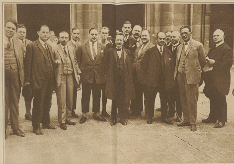
Die deutsche Delegation an der internationalen Friedenskonferenz in Paris. In der Mitte der Reichstagspräsident Loebe