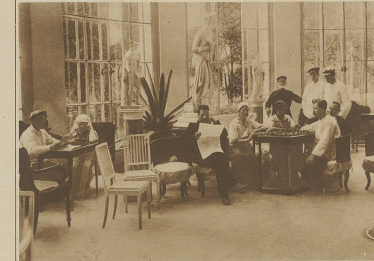
Die meisten Schlösser u. Landitze in der Umgegend von Leningrad (Petersburg) sind in Arbeiter-Erholungsheime umgewandelt worden. Das Bild zeigt den Klubraum in einem Schlosse auf Yelagin