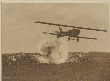
Aus den Manövern der amerikanischen Armee. Kampf eines Flugzeugs gegen Tanks