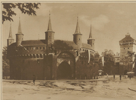
Der «Barbakan» und das Tor des heiligen Florians in Krakau, die beiden letzten Erinnerungen an die mittelalterlichen Befestigungen