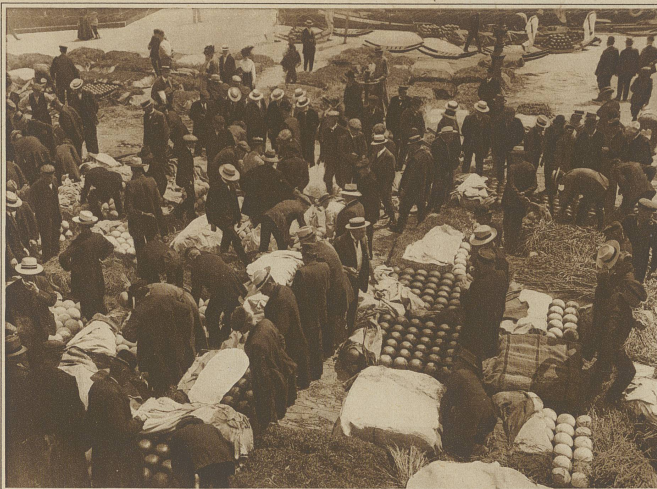
Leben und Treiben auf dem Käsemarkt

chene, grüne Wiesenflächen mit zahlreichen Viehherden. Hier ist der Landmann weniger Ackerbauer, als Viehzüchter und Käseproduzent. Die Käsefabrikation ist hier Hausindustrie, große moderne Käsereien, wie beispielsweise in der Schweiz gibt es weniger.