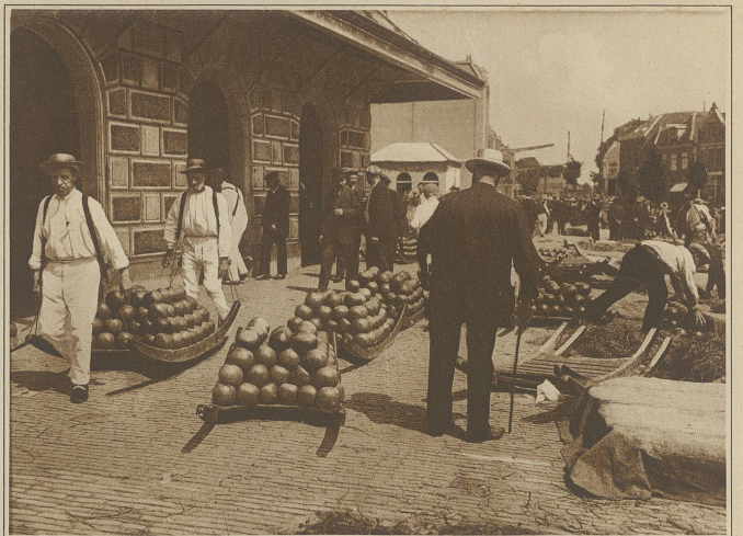
Vor der amtlichen Stadtwaage, wo einzeln die Feststellung der Gewichte erfolgen darf

Eine Sammelstelle für die einzelnen Produktionen ist der Ort Alkmaar im Norden Hollands mit zirka 18000 Einwohnern, ein freundliches Städtchen, das durch einen Schiffahrtskanal mit der Nordsee verbunden ist. Hier findet an jedem Freitag ein Käsemarkt, der größte ganz Hollands, statt und auf diesem herrscht ein recht interessantes Leben. Peinlich sauber geht es auf dem Markte zu; die weiße Kleidung der etwa dreißig angestellten Markthelfer mit farbigen Bändern an den Hüften und eigenartigen Tragbahnen, deren bunte Abzeichen mit den Hutbändern der Helfer zur Vermeidung von Verwechslungen des Käses beim Wägen, Fortschaffen usw. übereinstimmen, geben dem Markte ein eigenartiges Gepräge.