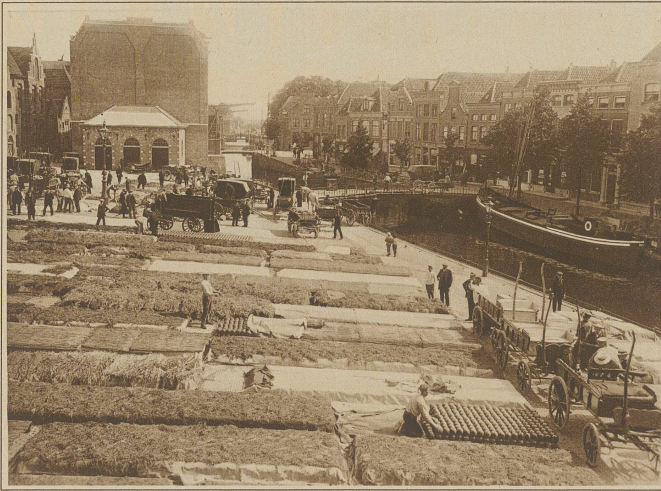
Blick auf den Markt. Bis zur vorgeschriebenen Eröffnung (10 Uhr) lagert der Käse mit Heu, Gras oder Planen zugedeckt

Dem schweizerischen Käseexport sind in den letzten Jahren verschiedene ernsthafte Konkurrenten erwachsen, so auch in Holland, das große Anstrengungen macht, um auf dem Weltmarkt zur Geltung zu kommen. Die Voraussetzung für eine gute und reiche Käsefabrikation sind im nördlichen Holland, wie nicht gleich in einem anderen Lande vorhanden. Einen Futtermangel kennt der holländische Bauer wenig oder gar nicht, denn das Land ist von so vielen Kanälen und Gräben durchzogen, daß die Weiden selbst in trockenen Jahren genügend feucht und fruchtbar sind. Reist man durch diese Gegend Hollands, so findet man immer das gleiche typische Bild: Weite, von Wasser unterbro-