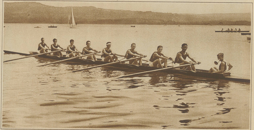
Der Junioren-Achter der Rudersektion des Fussballclub Zürich siegte im Preis der Stadt Yverdon