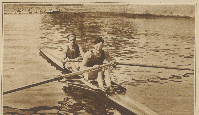
Ruder-Club Reuß-Luzern gewann die Meisterschaft im Zweier ohne Steuermann und wird die Schweiz an den Europa-Meisterschaften in Prag vertreten