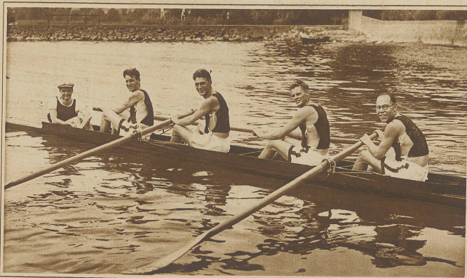
Die siegreiche Junioren-Mannschaft des Grasshopper-Vierers mit Steuermann