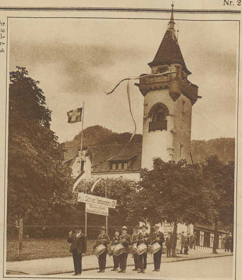
Schweizerisches Tambourenfest in Zürich Biel-Bözingen beim Abmarsch zum Wettkampf