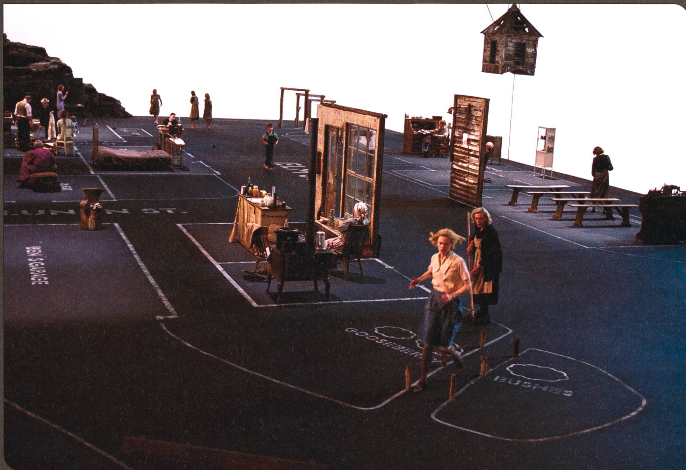
Dogville, petit village américain « mis en scène » par Lars von Trier