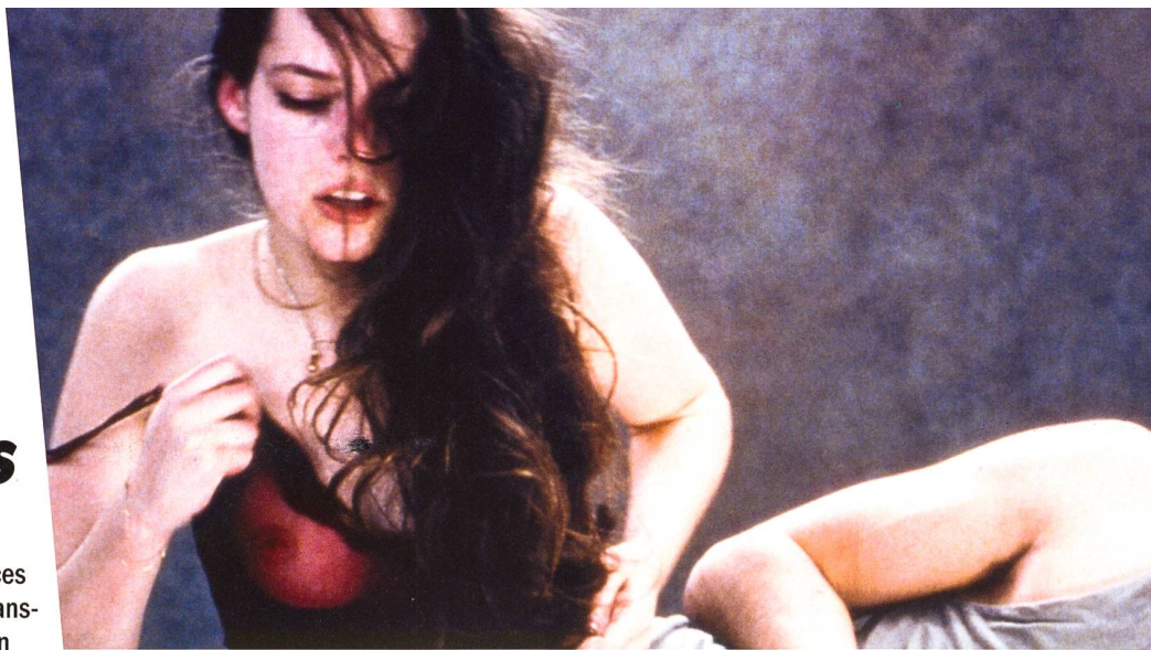
Roxane Mesquida dans «Sex Is Comedy» de Catherine Breillat