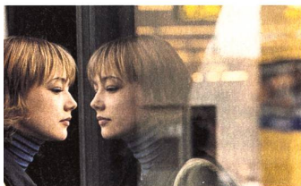
Photo de couverture : Edward Norton dans « La 25 e heure » de Spike Lee