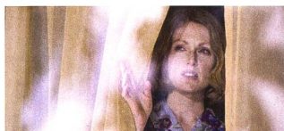
Photo de couverture : Julianne Moore dans « Loin du paradis » de Todd Haynes