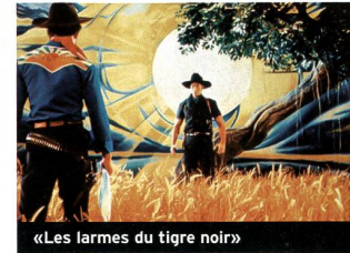
«Les larmes du tigre noir»