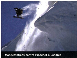
Manifestations contre Pinochet à Londres