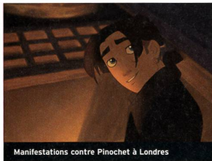
Manifestations contre Pinochet à Londres