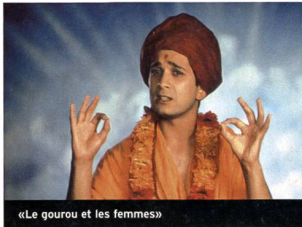
«Le gourou et les femmes»