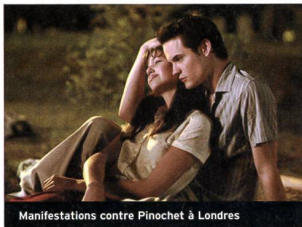
Manifestations contre Pinochet à Londres