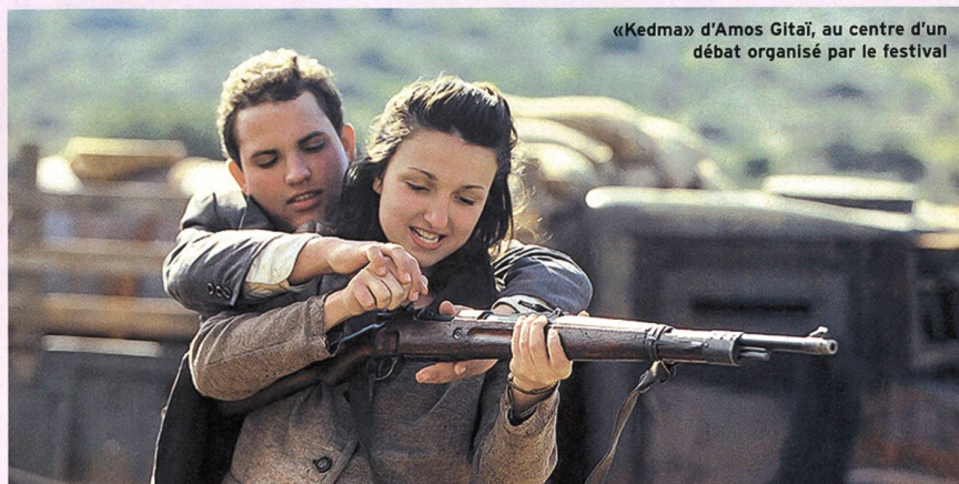
«Kedma» d'Amos Gitai, au centre d'un débat organisé par le festival

1. Sortie prévue en janvier aux éd. Cahiers du Cinéma.