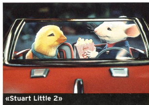
«Stuart Little 2»