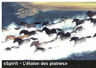
«Spirit - L'étalon des plaines»