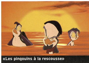
«Les pingouins à la rescousse»