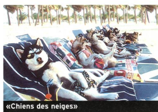
«Chiens des neiges»

Avec Fanny Ardant, Roshdy Zem, Sami Bouajila (2002, France - CAC-Voltaire). Durée 1 h 41. En salle du 1 er au 20 octobre au CAC-Voltaire, Genève.