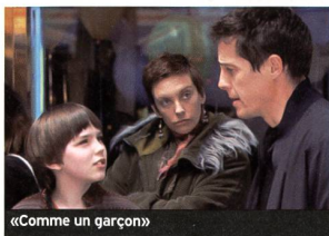
«Comme un garçon»

Avec Albert Dupontel, Marianne Denicourt... (2001, France JMH). Durée 1 h 32. En salles le 21 août.