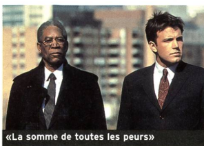
«La somme de toutes les peurs»

«The Sum of All Fears». Avec Ben Affleck, Morgan Freeman, James Cromwell, Alan Bates... (2002, USA - UIP). Durée 2 h 04. En salles le 14 août.