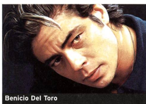
Benicio Del Toro