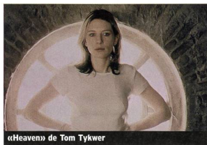
«Heaven» de Tom Tykwer