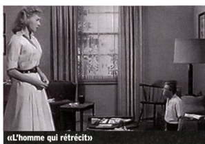
«L'homme qui rétrécit»