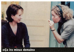
«Ça ira mieux demain»