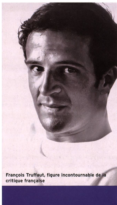
François Truffaut, figure incontournable de la critique française

Thierry Jobin La critique romande est très différente de la critique française. En Suisse romande, on est trop peu nombreux pour qu'il y ait de la concurrence ou pour qu'on se batte. Il me semble aussi qu'il y a beaucoup plus de terrorisme dans la presse française. A la sortie des visions de presse à Paris, on voit toujours les mêmes groupes forger leur avis. En Suisse romande, quand on se voit pour les séances de presse, c'est très bon enfant.