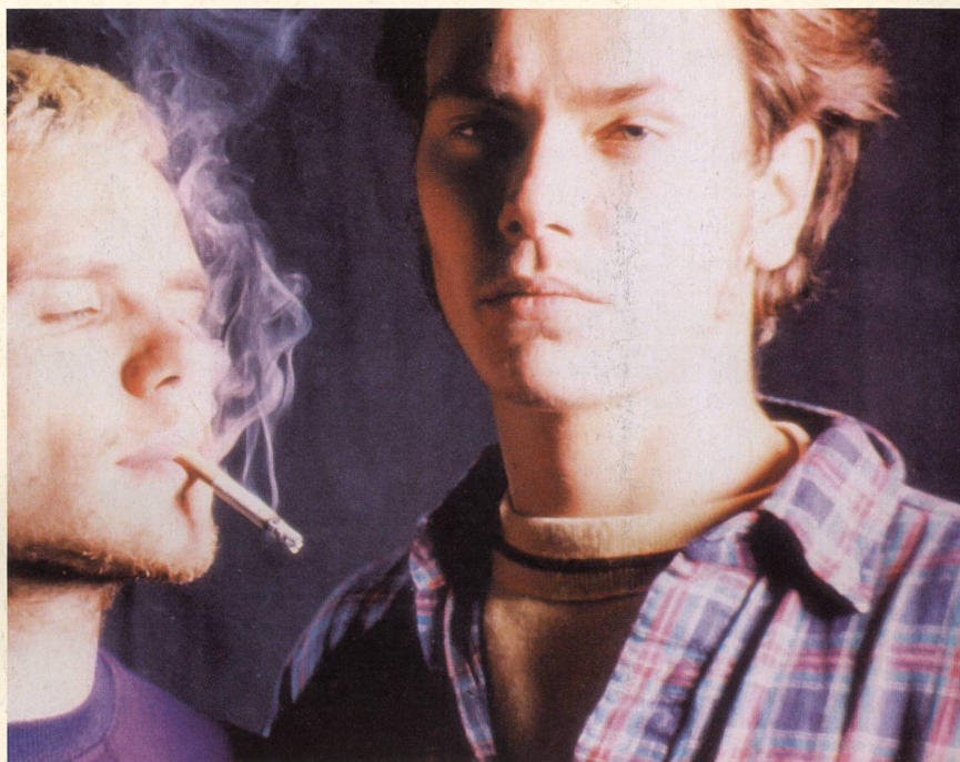
«My Own Private Idaho», road movie de Gus Van Sant