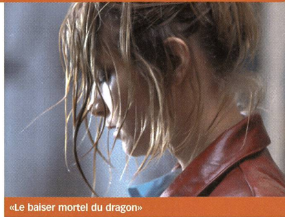
«Le baiser mortel du dragon»

«Planet of the Apes». Avec Marc Wahlberg, Helena Bonham Carter, Tim Roth... (2001, USA - Twentieth Century Fox). Durée 1 h 44. En salles le 22 août.