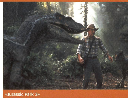
«Jurassic Park 3»

autres celui des geôliers. Rapidement, les matons abusent de leur pouvoir et la situation dégénère... Oliver Hirschbiegel s'est inspiré d'une recherche, minutieusement restituée, réalisée à l'Université de Stanford en 1971: après sept jours, on arrêta tout, tant les vingt hommes étaient devenus incontrôlables... (al)