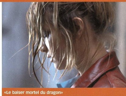
«Le baiser mortel du dragon»

«Planet of the Apes». Avec Marc Wahlberg, Helena Bonham Carter, Tim Roth... (2001, USA - Twentieth Century Fox). Durée 1 h 44. En salles le 22 août.