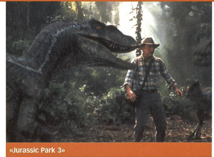
«Jurassic Park 3»

autres celui des geôliers. Rapidement, les matons abusent de leur pouvoir et la situation dégénère... Oliver Hirschbiegel s'est inspiré d'une recherche, minutieusement restituée, réalisée à l'Université de Stanford en 1971: après sept jours, on arrêta tout, tant les vingt hommes étaient devenus incontrôlables... (al) «Das Experiment». Avec Moritz Bleibtreu, Christian Berkel, Oliver Stokowski... (2001, Allemagne - Elite). Durée 2 h 00. En salles le 15 août.