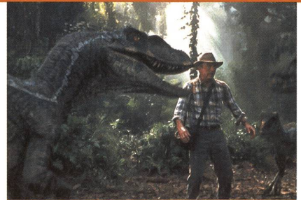
«Jurassic Park 3»

autres celui des geôliers. Rapidement, les matons abusent de leur pouvoir et la situation dégénère... Oliver Hirschbiegel s'est inspiré d'une recherche, minutieusement restituée, réalisée à l'Université de Stanford en 1971: après sept jours, on arrêta tout, tant les vingt hommes étaient devenus incontrôlables... (al) «Das Experiment». Avec Moritz Bleibtreu, Christian Berkel, Oliver Stokowski... (2001, Allemagne - Elite). Durée 2 h 00. En salles le 15 août.