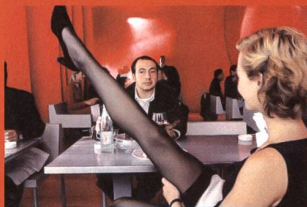
«L'art (délicat) de la séduction»