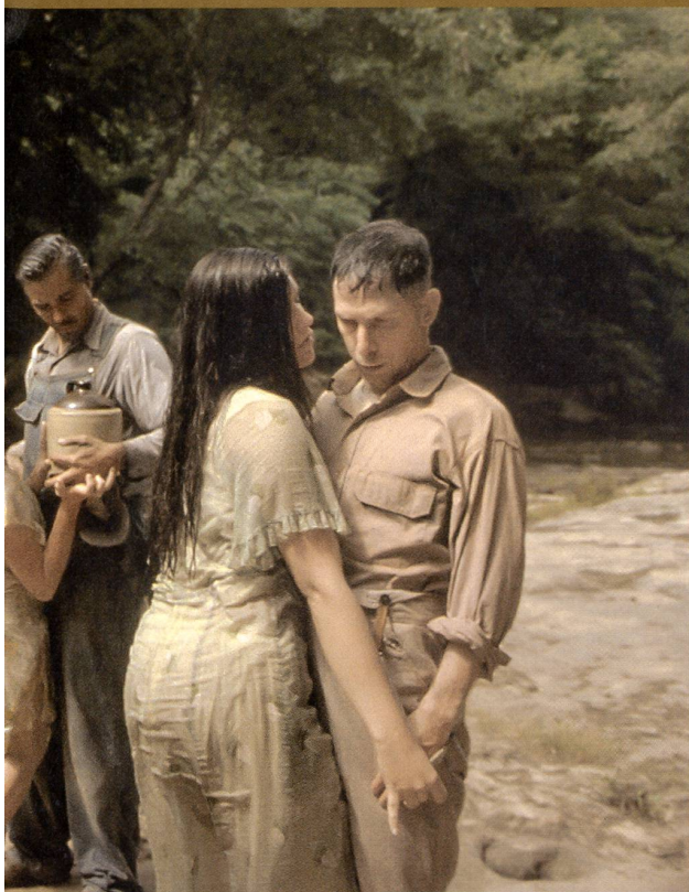
Les sirènes de «L'odyssée» version Coen