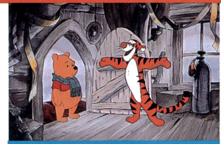
«Les aventures de Tigrou»

1. On entend par slasher le sous-genre du film d'horreur inauguré par «Halloween» (John Carpenter, 1978) où un tueur psychopathe assassine en série de jeunes adolescents d'une manière particulièrement brutale.