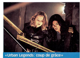
«Urban Legends: coup de grâce»