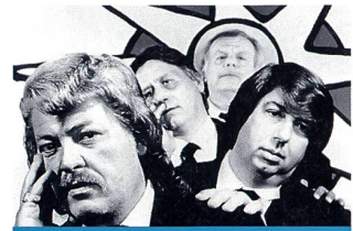
«Mais qui a tué Tano?»