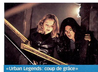
«Urban Legends: coup de grâce»