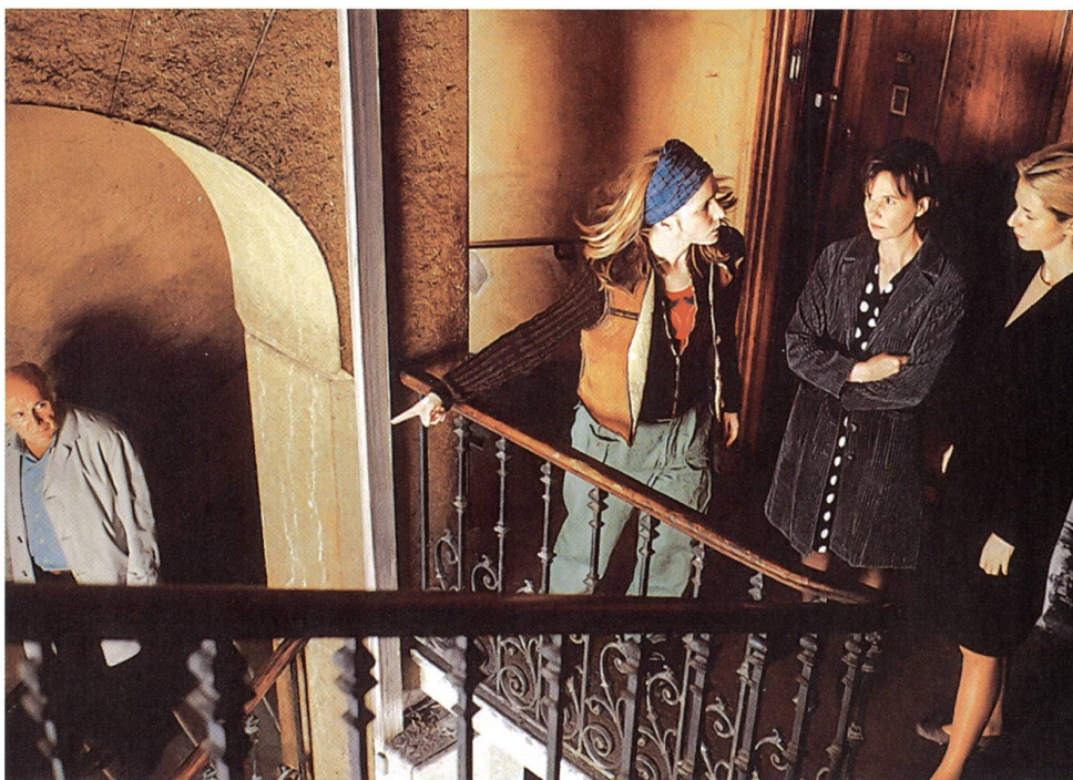
«Tout va bien, on s'en va» de Claude Mouriéras, en avant-première à Neuchâtel. Avec Michel Piccoli, Natacha Régner, Miou-Miou et Sandrine Kiberlain

Les 15, 16 et 17 septembre dans tous les cinémas de Sion. Programme disponible dans les salles dès le 7 septembre. Toutes les places à 10 francs. Renseignements : 027 322 51 93