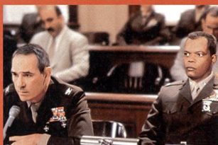
«L'enfer du devoir»

«Nutty Professor 2: The Klumps». Avec Eddie Murphy, Janet Jackson, Larry Miller, John Ales... (2000, USA - UIP). Durée 1 h 50. En salles le 30 août.