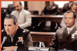
«L'enfer du devoir»

«What Lies Beneath». Avec Michelle Pfeiffer, Harrison Ford... (2000, USA - Twentieth Century Fox). Durée 2 h 09. En salles le 13 septembre.