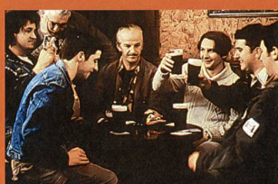
«The Closer You Get»