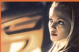
«60 secondes chrono»