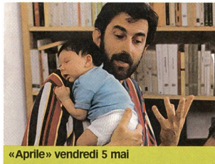
«Aprile» vendredi 5 mai