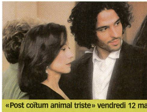
«Post coïtum animal triste» vendredi 12 mai