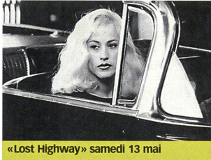
«Lost Highway» samedi 13 mai