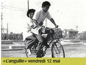
«L'anguille» vendredi 12 mai