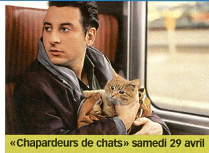
«Chapardeurs de chats» samedi 29 avril

«Unagi», avec Koji Yakusho, Misa Shimizu... (1997). Durée 1 h 55. Vendredi 12 mai, 23 h 50, TSR2.