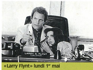
«Larry Flynt» lundi 1 er mai