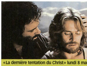
«La dernière tentation du Christ» lundi 8 mai