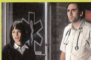
«A tombeau ouvert»