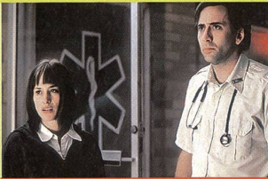
«A tombeau ouvert»