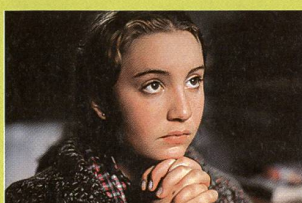
«La vie moderne»