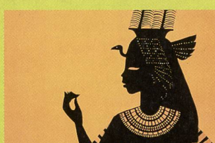
«Princes et princesses»