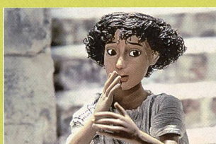
«Il était une fois Jésus»