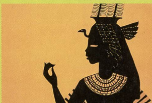
«Princes et princesses»