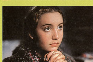
«La vie moderne»