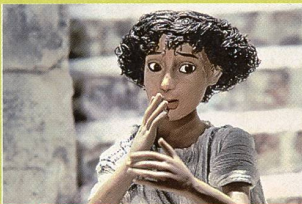
«Il était une fois Jésus»