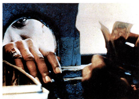
Haut: «Chitra nadir pape» (La rivière Chitra coule tranquillement) de Mokammel Tanvir, Bangladesh, 1999