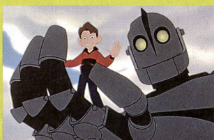
«The Iron Giant»