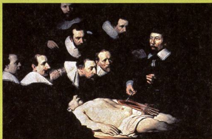
«Rembrandt Van Rijn»

«October Sky». Avec Jake Gyllenhaal, Chris Cooper... (1999, USA - UIP). Durée 1 h 47. En salles le 26 janvier.