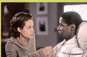
«The Bone Collector»

Avec Jean-Pierre Marielle, Anne Parillaud, Alessandra Martines, Marianne Denicourt... (1999, France - MBP). Durée 2 h 03. En salles le 5 janvier.