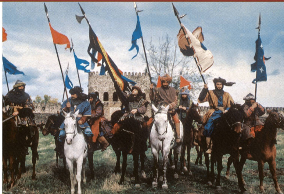
«Brigands, chapitre VII», septième film d'Otar Iosseliani, est présenté dans le cadre d'une rétrospective du CAC-Voltaire consacrée au cinéaste

creuset singulier d'où vont s'échapper tous les films à venir.