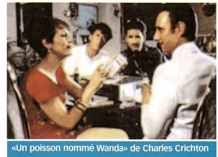
«Un poisson nommé Wanda» de Charles Crichton