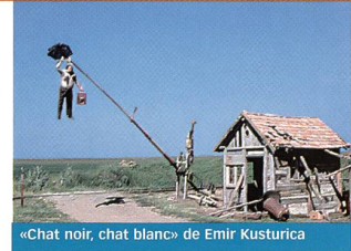
«Chat noir, chat blanc» de Emir Kusturica

Dans une lettre adressée à ses amis cinéastes, Patrice Leconte («Ridicule», «La fille sur le pont») fait état de son ras-le-bol vis-à-vis d'une certaine attitude de la critique française qui dégomme des films en dix lignes. Le débat est lancé, puisque le quotidien Libération, particulièrement visé par cette «critique», a publié un entretien (pacifique) avec le réalisateur des «Bronzés». Et FILM, dans tout ça? ■