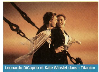
Leonardo DiCaprio et Kate Winslet dans «Titanic»