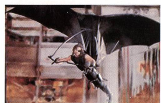
«Los Angeles 2013» de John Carpenter