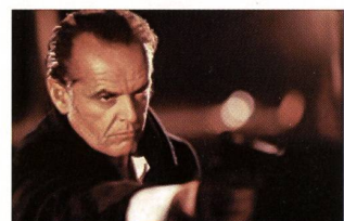
Jack Nicholson dans «Crossing Guard»