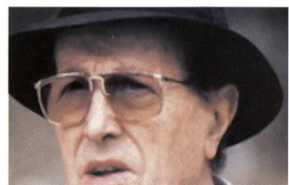
Manoel de Oliveira