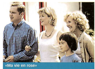
«Ma vie en rose»