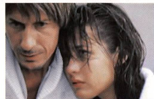
Jacques Dutronc et Sophie Marceau