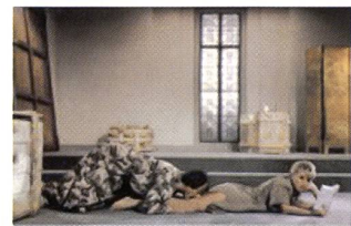
Patrick Chesnais et Miou Miou dans «La lectrice»