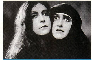
«La couronne d'épines»