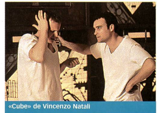
«Cube» de Vincenzo Natali