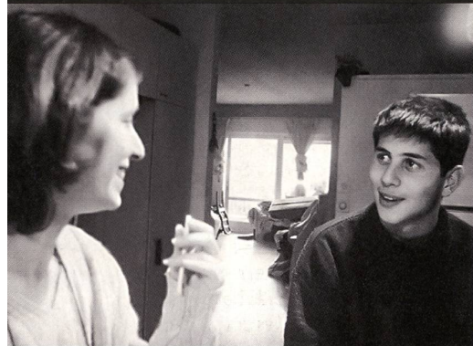
« A great kid » de Keren Margalit