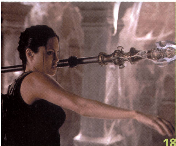
Die Leinwand im Visier: Zum Start von «Tomb Raider» beschäftigt sich FILM mit Lara Croft, «Final Fantasy» und den Games als neuer Kunstform.