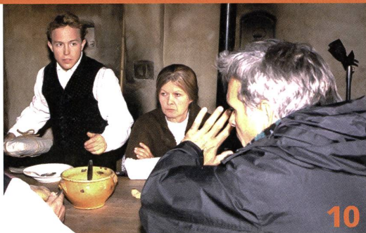
«Das Fähnlein der sieben Aufrechten»: Gedreht wurde im Freilichtmuseum Ballenberg, mit wenig Geld und wenig Respekt für historische Genauigkeit, dafür mit um so mehr Enthusiasmus und einem klaren Konzept.