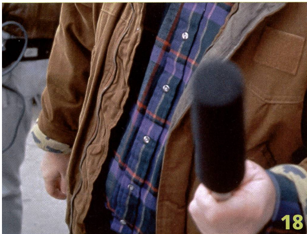
Dokumentarfilme sind der Welt auf eine andere Weise verpflichtet als das Erzählkino. Warum es trotzdem nicht möglich ist, die Wirklichkeit einfach einzufangen, untersucht FILM ab Seite 18.