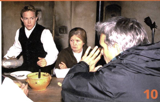
«Das Fähnlein der sieben Aufrechten»: Gedreht wurde im Freilichtmuseum Ballenberg, mit wenig Geld und wenig Respekt für historische Genauigkeit, dafür mit um so mehr Enthusiasmus und einem klaren Konzept.