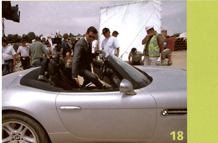
Das Automobil und das Kino sind fast gleich alt. Und beide versprechen oft mehr, als sie halten. Wie das Kino die blecherne Konkurrenz im Kampf um die Männergunst in Schach hält zeigen wir ab Seite 18.