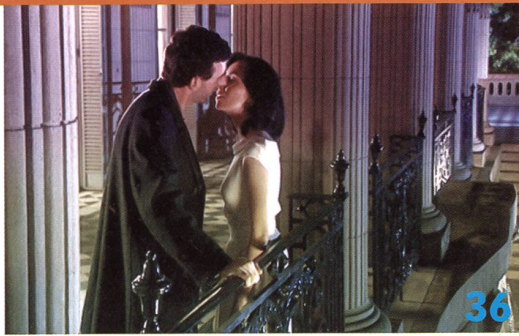
«Las aventuras de Dios»: Der Argentinier Eliseo Subiela (El lado oscuro del corazón, 1992) eifert Luis Buñuels filmischem Surrealismus nach und hält die Protagonisten seines Filmes in ihrem eigenen Traum gefangen.