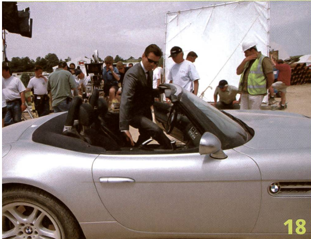
Das Automobil und das Kino sind fast gleich alt. Und beide versprechen oft mehr, als sie halten. Wie das Kino die blecherne Konkurrenz im Kampf um die Männergunst in Schach hält zeigen wir ab Seite 18.