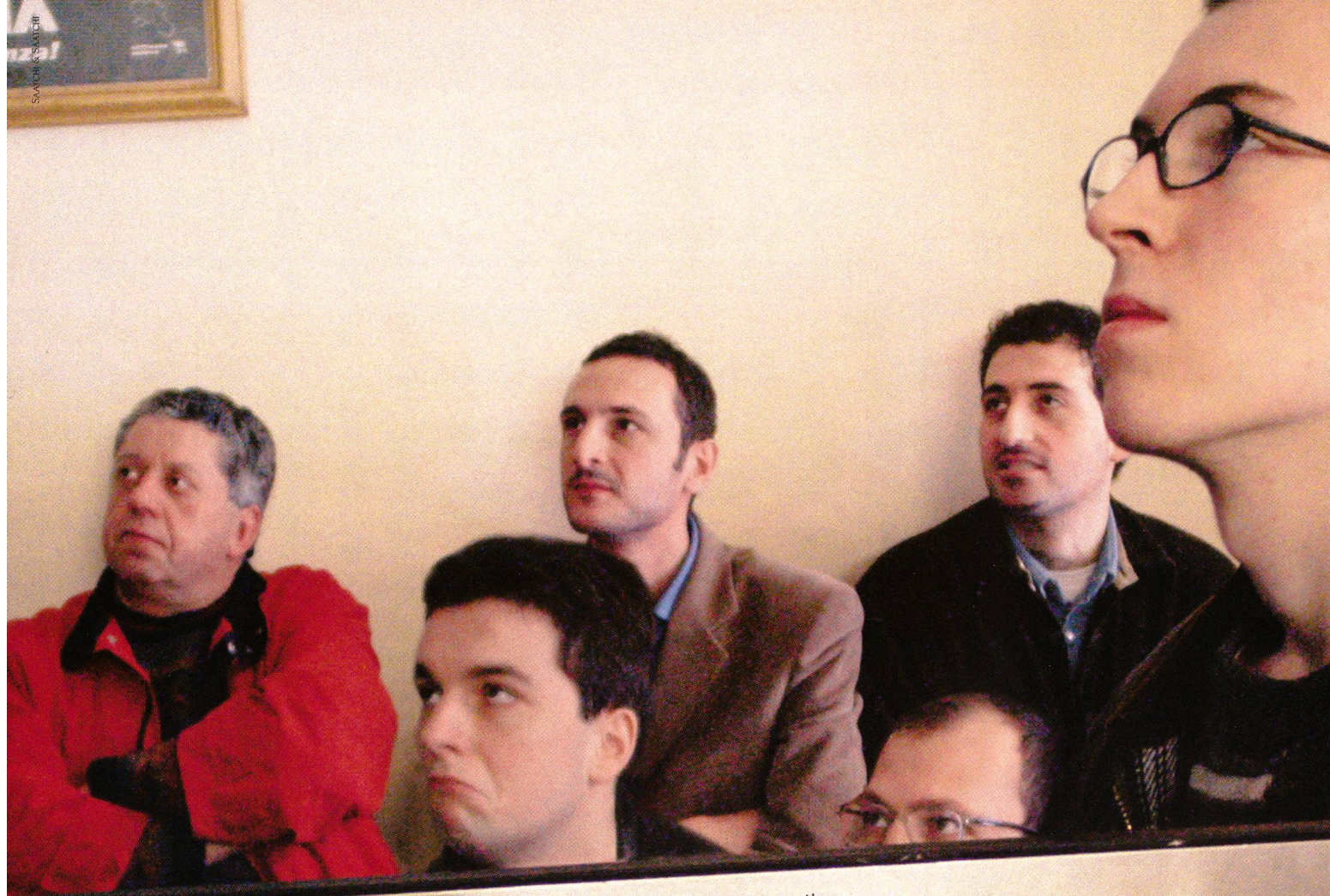
Eigengoal von Fiorentina. Digitalfotografie von Dario Mitidieri. Grafische Details von Sony Cyber-shot.