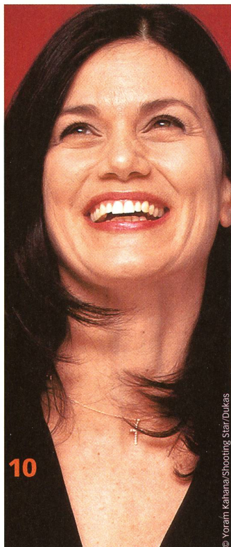
Erotik mischt sich immer ein, wenn Linda Fiorentino in der Nähe ist. FILM hat sie in Berlin getroffen