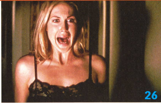
«Scream» zum Dritten: Noch immer geht der Mörder mit der Furcht erregenden Maske um. Opfer findet er reichlich. Unterhaltsamer letzter Teil der Trilogie