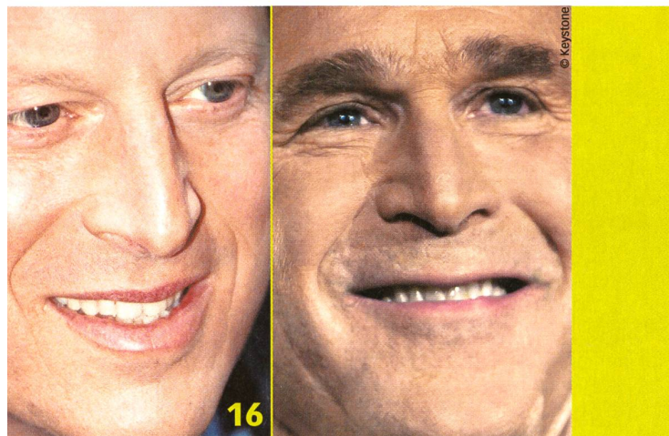
Al Gore und George W. Bush: Einer der beiden wird im Herbst voraussichtlich amerikanischer Präsident. Das Zünglein an der Waage könnte beim Wahlkampf Hollywood spielen