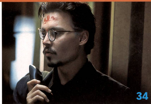
Roman Polanskis Comeback: Mit «The Ninth Gate» knüpft er an seine frühen Erfolge wie «Rosemary's Baby» an.