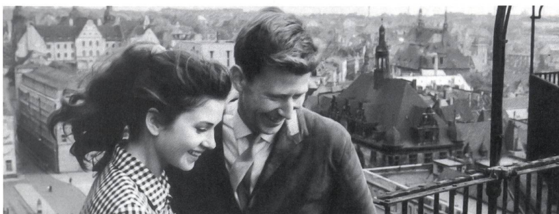
Konrad Wolfs «Der geteilte Himmel», nach dem Buch von Christa Wolf