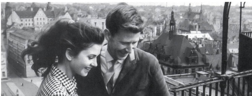
Konrad Wolfs «Der geteilte Himmel», nach dem Buch von Christa Wolf