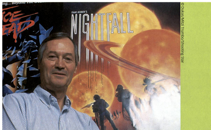
B-Picture-König Roger Corman, sein Imperium und seine Zöglinge