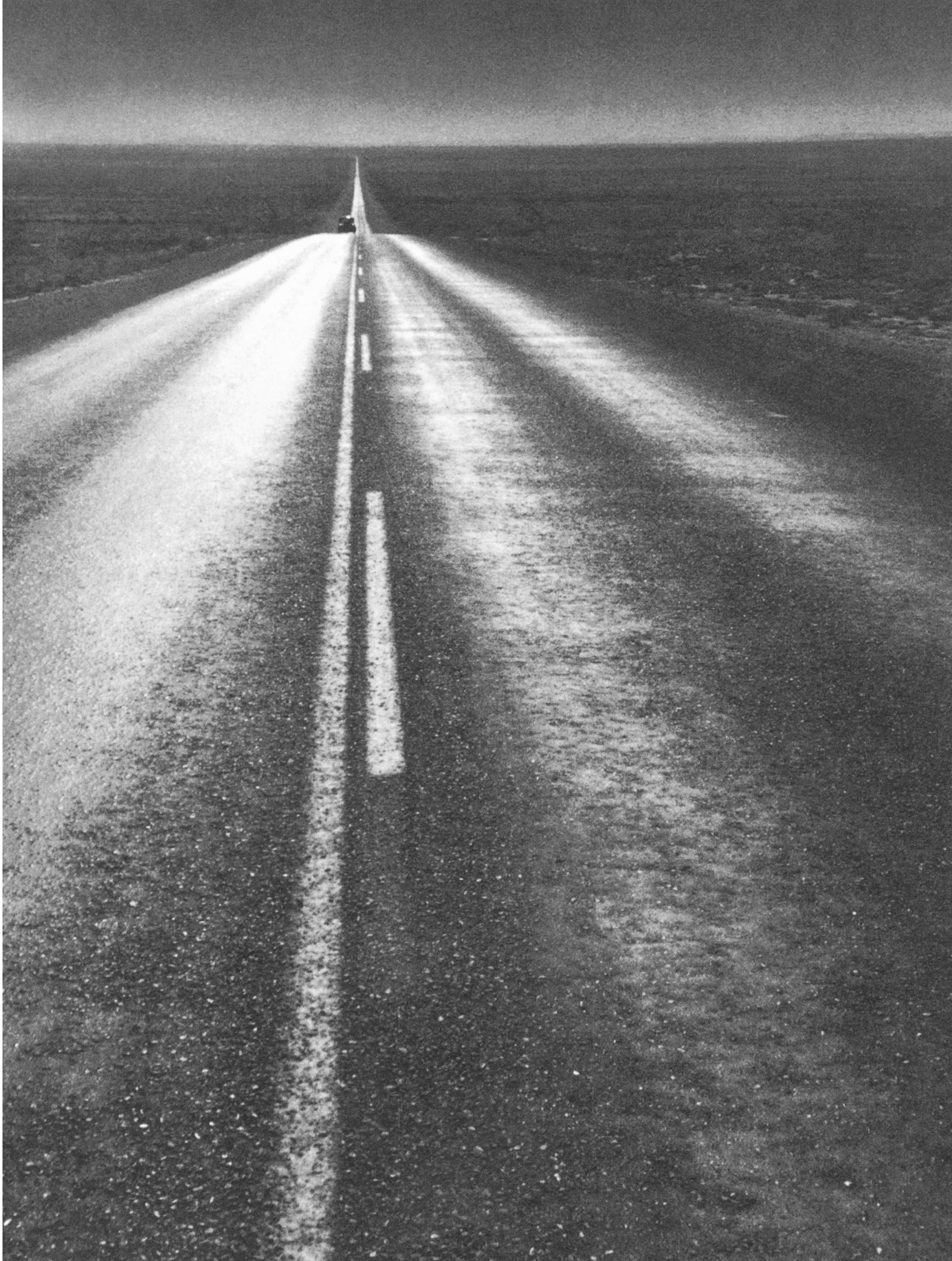
US Bundesstrasse 258, New Mexico, 1955/56