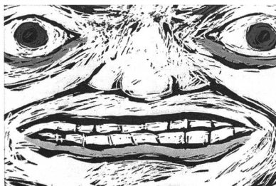
Bildphasen aus «Amok» von Claudius Gentinetta

Wenn die Agentur sich auch um Trickfilme kümmern wird, auf jeden Fall. Aber ehrlich gesagt, ich bin nicht sehr involviert in diese ganze Diskussion. Personen aus meinem Umfeld wie mein Produzent informieren mich gelegentlich über die neuesten Entwicklungen. In diesen Dingen bin ich ein «Larifari». Ich bin ein Typ, der in erster Linie seine Filme realisieren